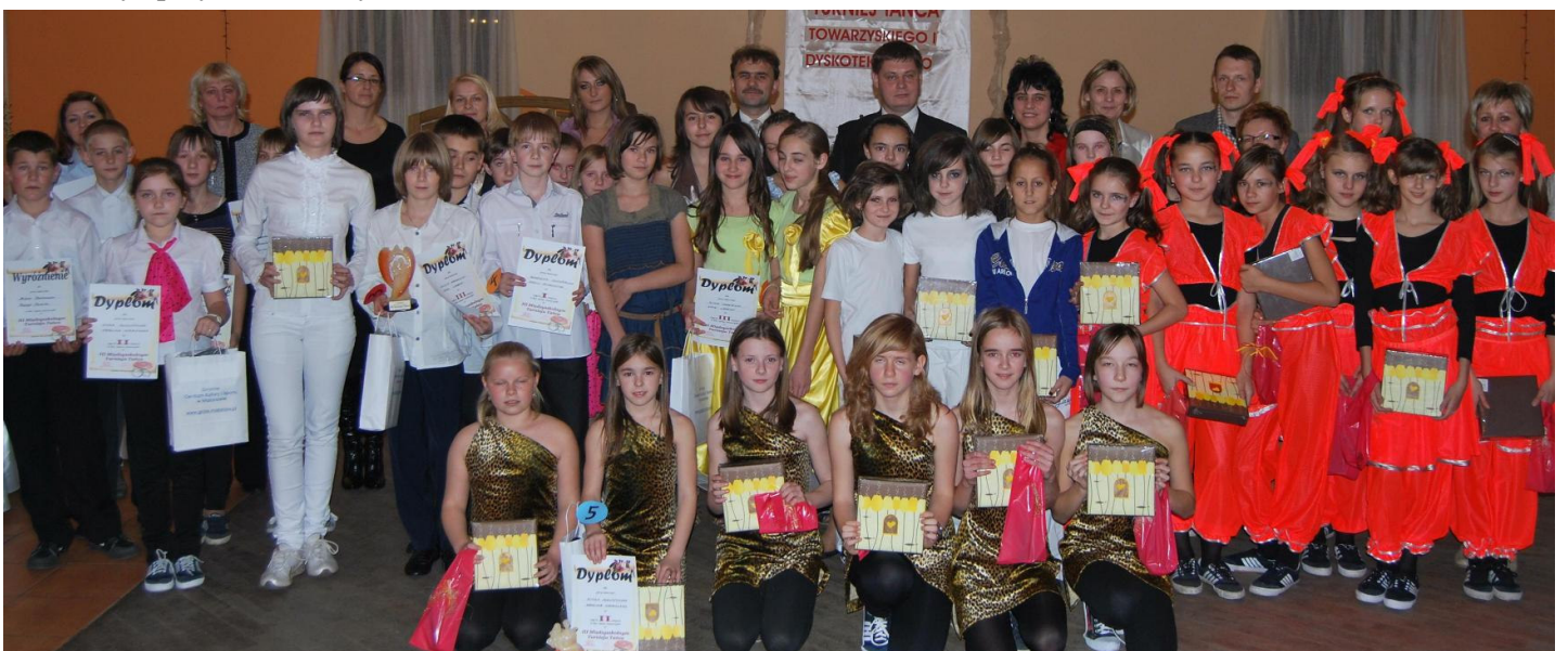
Tancerze biorący udział w tegorocznym turnieju