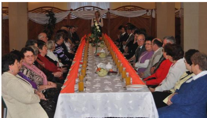
Seniorzy ze Stowarzyszenia Nadzieja

S towarzystwo „Nadzieja” w Malanowie po raz kolejny zorganizowało uroczyste spotkanie z okazji przypadającego 14 listopada Światowego Dnia Seniora. Uroczystość pod hasłem „Jesień z Nadzieją” odbyła się w środę 10 listopada w restauracji Hacjenda.