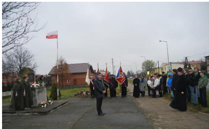
Uroczyste złożenie kwiatów pod pomnikiem