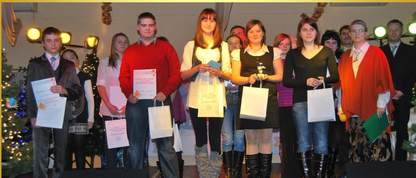
Zdobywcy Grand Prix - zespół GAMA z Gminnego Ośrodka Kultury w Kłodawie