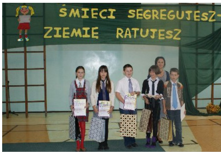
Laureaci z SP w Malanowie