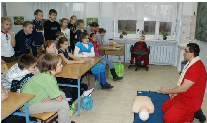
Pokaz udzielania pierwszej pomocy

Zajęcia przeprowadzone były w ciekawy sposób przez ratownika medycznego z Fundacji Złota Godzina, który zaszczerpił w uczniach odwagę i chęć działania