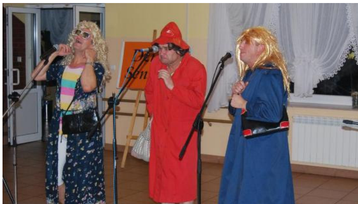
Występ kabaretu Kłapa