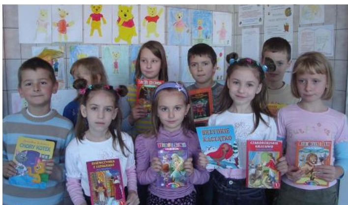
Laureaci konkursów bibliotecnych

Podsumowaniem Miesiąca Bibliotek Szkolnych był wyjazd w dniu 27 października 2010 r. do Biblioteki Pedagogicznej w Turku. Uczniowie klasy IV i VI wraz z wychowawcami E. Młotkiewicz i B. Żebruń zapoznali się z zasadami funkcjonowania i korzystania z biblioteki,