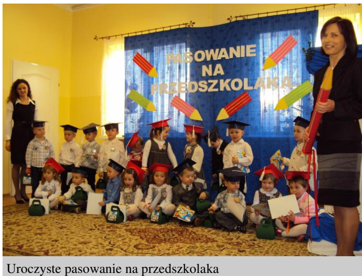
Uroczyste pasowanie na przedszkolaka