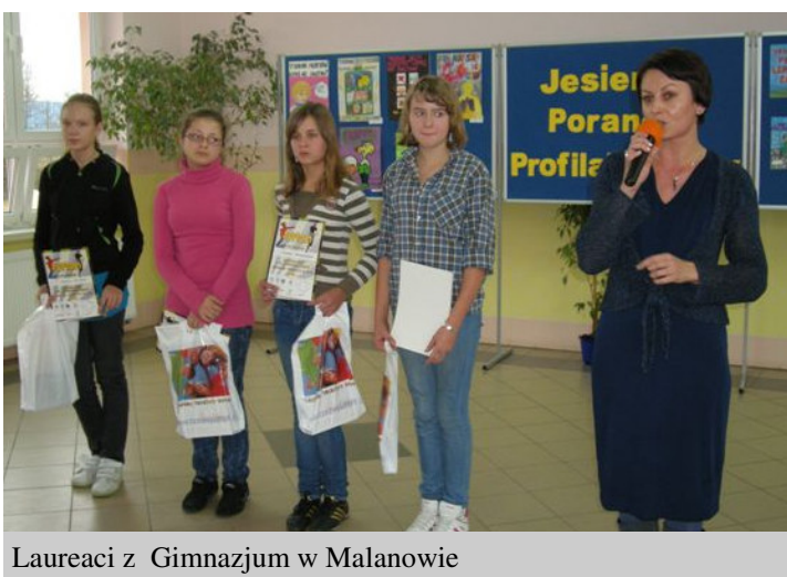
Laureaci z Gimnazjum w Malanowie

Laureatom wręczono dyplomy i grę komputerową SAMOROST.